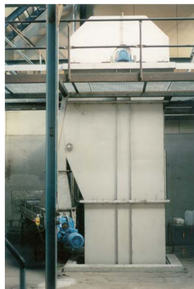
Rüben- und Zuckerelevatoren Beet and sugar elevators Élévateurs à betteraves et sucre