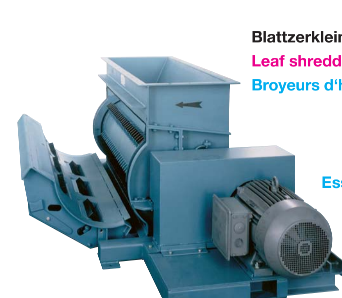
Blattzerkleinerer Leaf shredders Broyeurs d'herbes