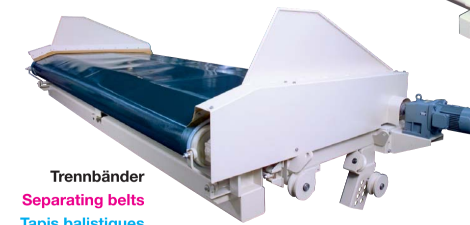
Trennbänder Separating belts Tapis balistiques