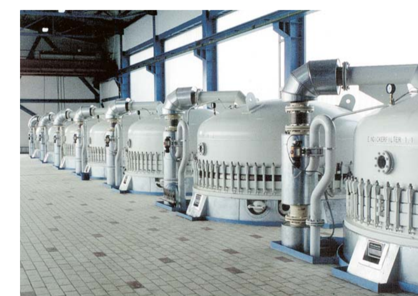
Rahmen- und Kerzenfilter bis 300 m² Filterfläche Frame and candle filters up to 3230 ft² filter surface Filtres à bougies et filtres à cadres jusqu'à 300 m² de surface de filtration