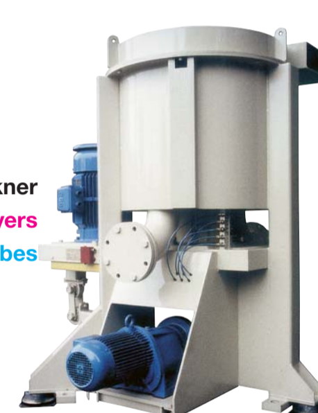
Blattvortrockner Leaf pre-dryers Essoreuses à herbes