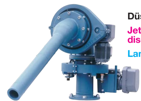
Düschenschwenkvorrichtungen Jet swiveling devices for wet discharge Lances d'abattage motorisées