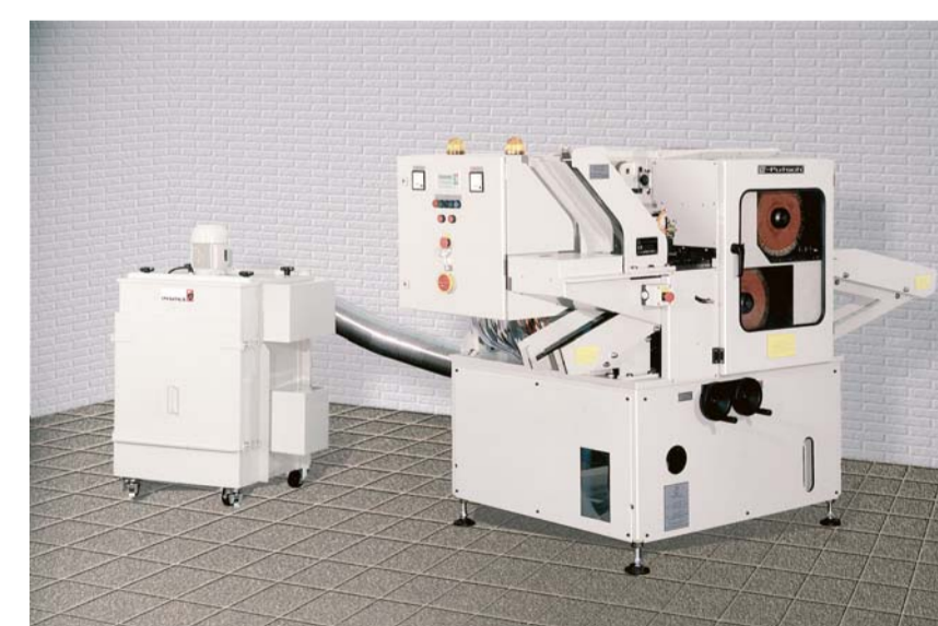
Reinigungs- und Sortierautomaten für Schnitzmesser. Automatic cleaning and sorting machines for beet knives. Brosseuses-trieuses pour couteaux de diffusion.