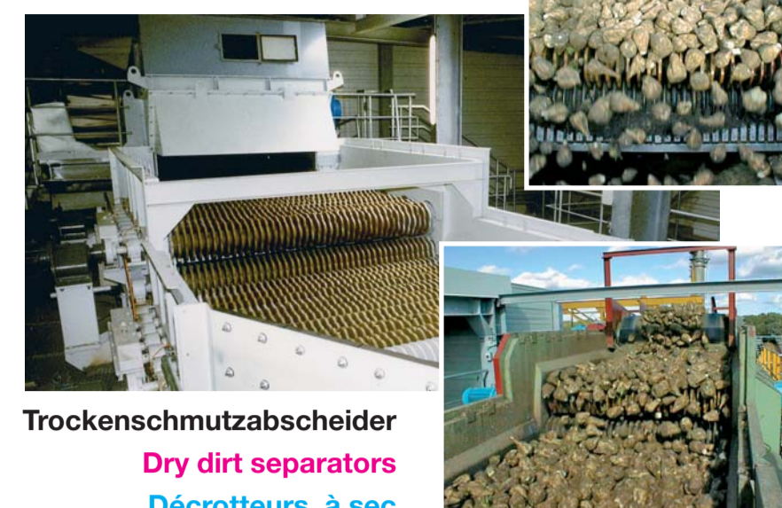
Trockenschmutzabscheider Dry dirt separators Décrotteurs à sec