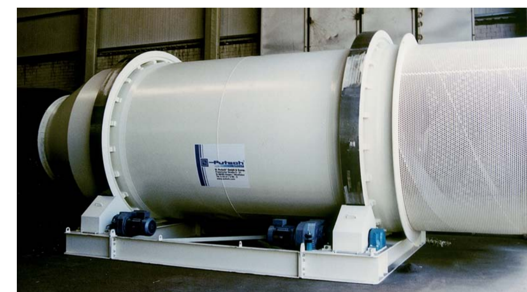
Vorwaschtrommeln Pre-washing drums Tambours prélaveurs