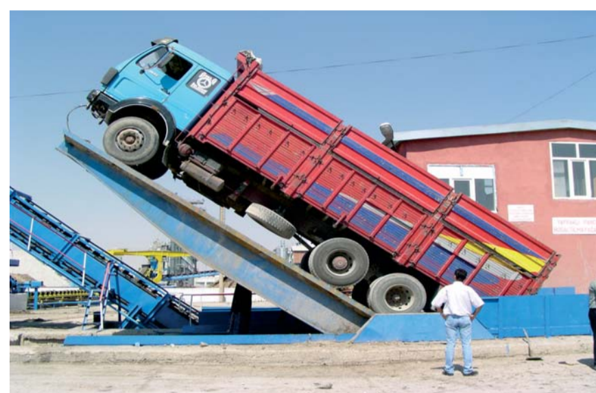
Entladungssysteme Unloading platforms Basculeurs