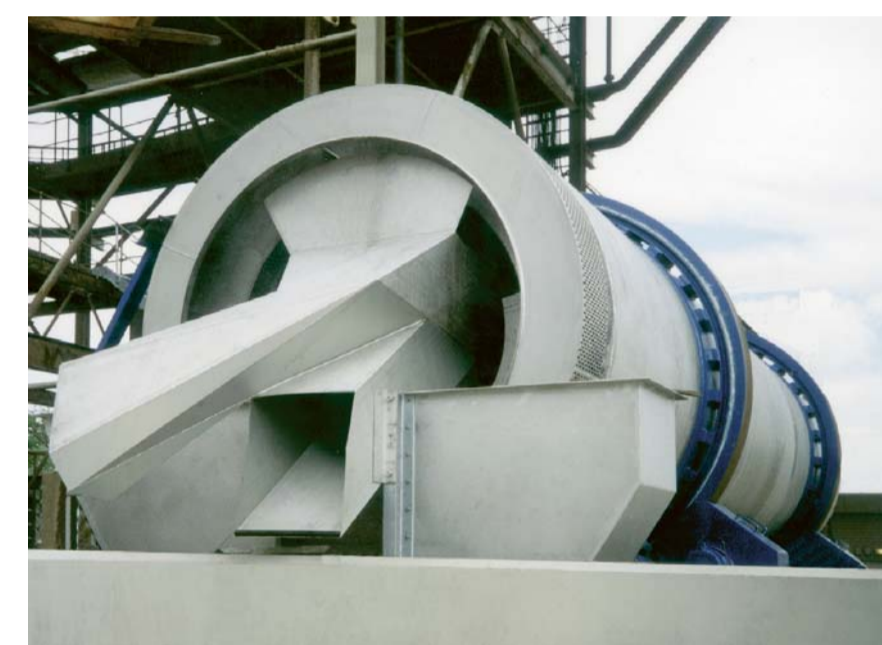
Steinwäscher Stone washers Laveurs de pierres