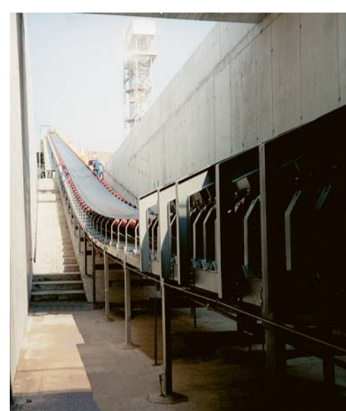
Förderbänder Belt conveyors Bandes transporteuses