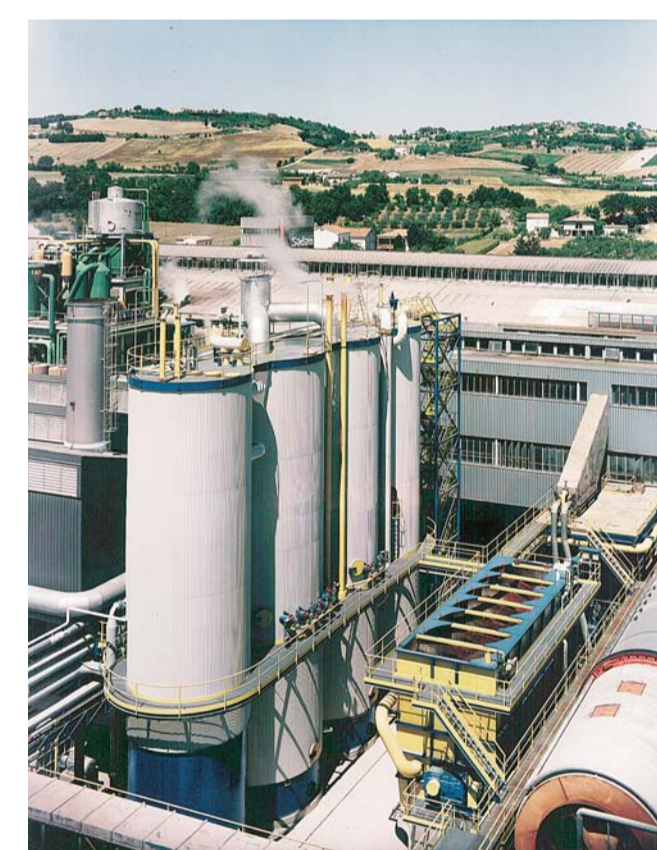
Komplette Saftreinigungsanlagen von der Planung bis zur Inbetriebnahme. Complete juice purification plants from planning to start up. Épurations complètes depuis l'ingénierie jusqu'à la mise en service.