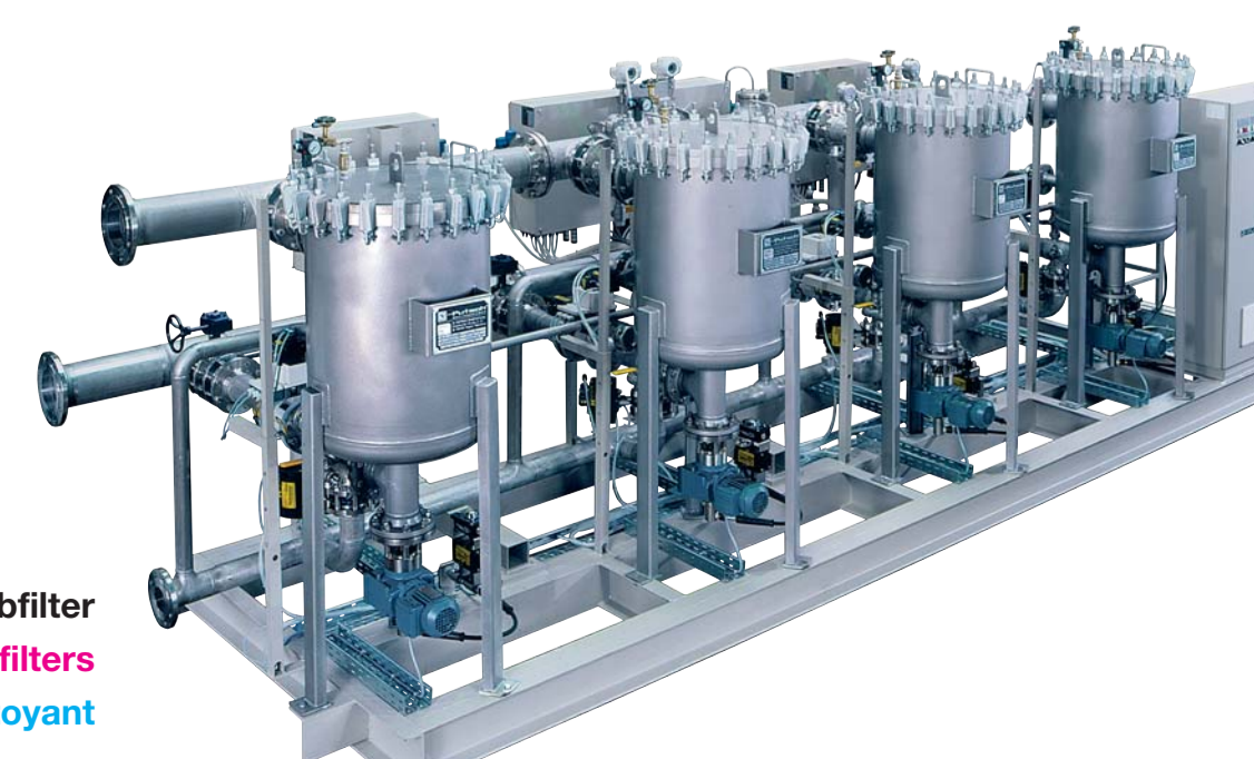
Sibomat: Automatische selbstreinigende Siebfilter Sibomat: Self cleaning screen filters Batteries de Sibomat: Filtres à tamis automatique auto-nettoyant