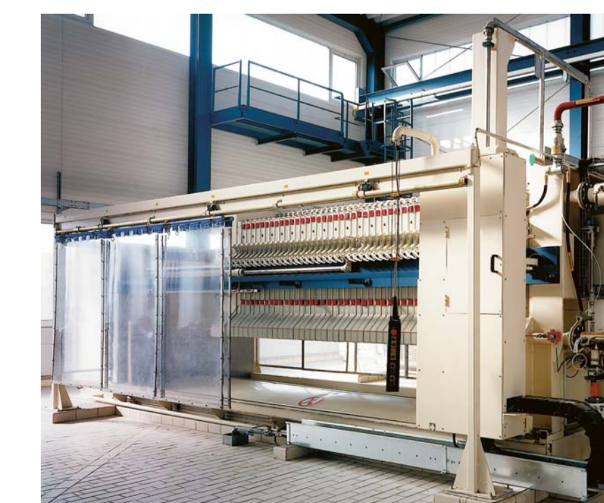
Zuckerabfüllanlagen Sugar bulk loaders Manutention du sucre