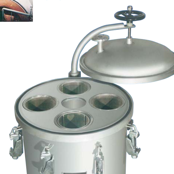
Beutefiltersysteme Bag filter systems Systèmes de filtration à poches