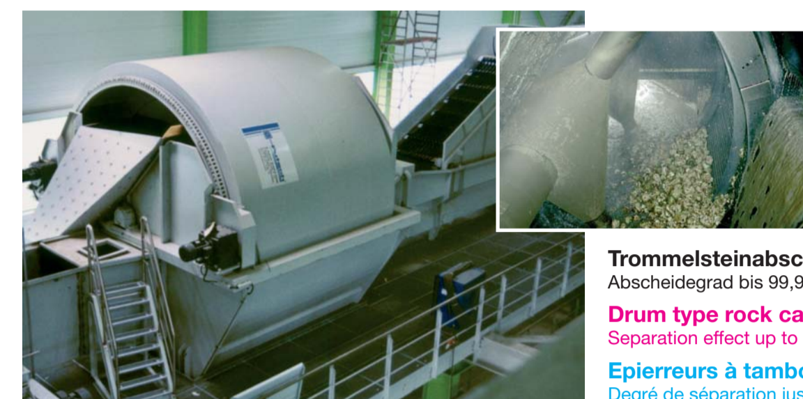
Trommelsteinabscheider Abscheidegrad bis 99,9% Drum type rock catchers Separation effect up to 99,9% Epiereurs à tambour Degré de séparation jusqu'à 99,9%