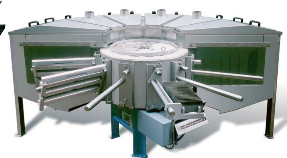
Messerkastenwaschautomaten Rotary washing machines Nettoyeuses rotatives