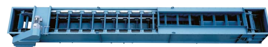
Zellenförderer Belt cell conveyors Convoyeurs à plateaux