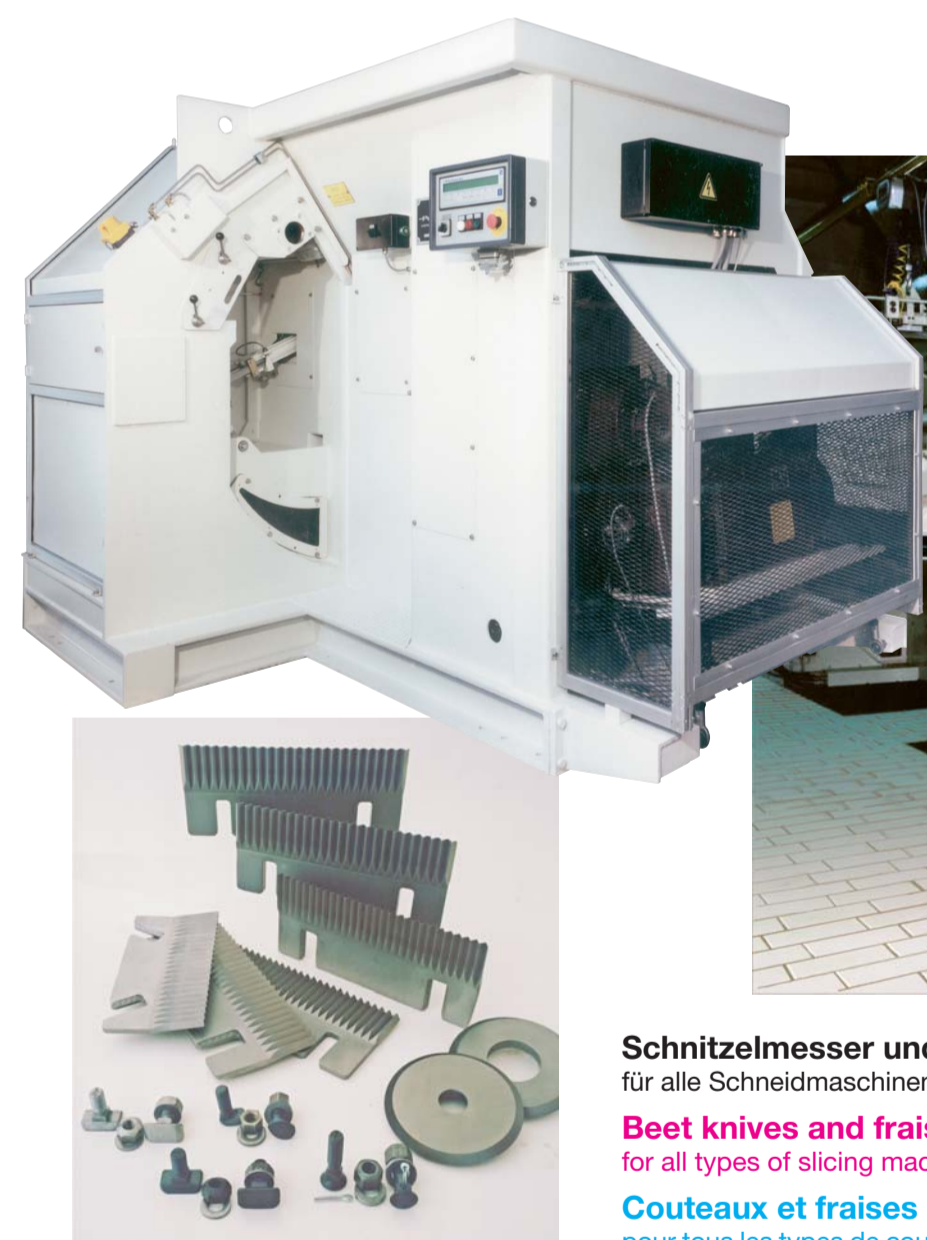
Schnitzmesser und Fräser für alle Schneidmaschinentypen Beet knives and fraisers for all types of slicing machines Couteaux et fraises pour tous les types de coupe-racines

Neue Ausführung New design nouvelle version