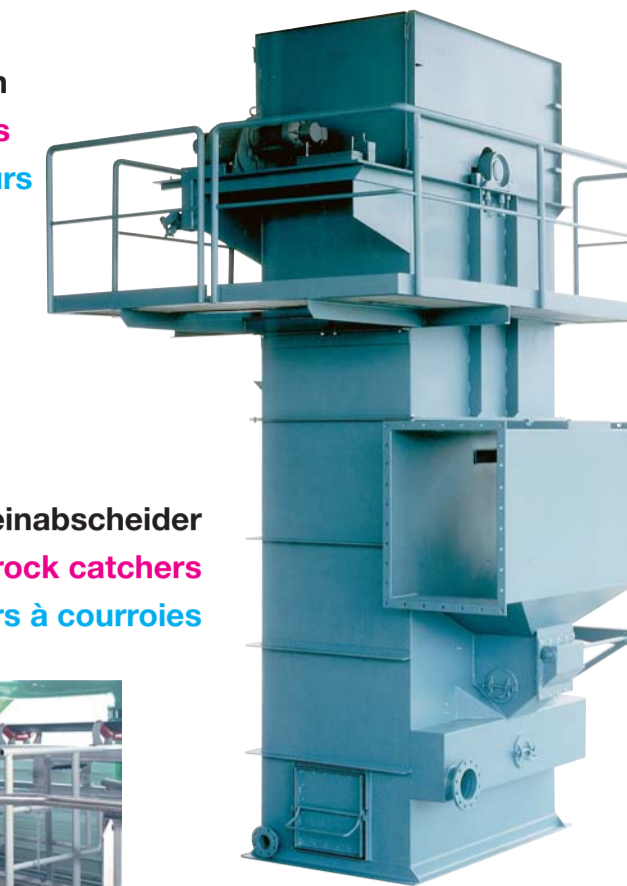
Gurtsteinabscheider Belt type rock catchers Epiereurs à courroies