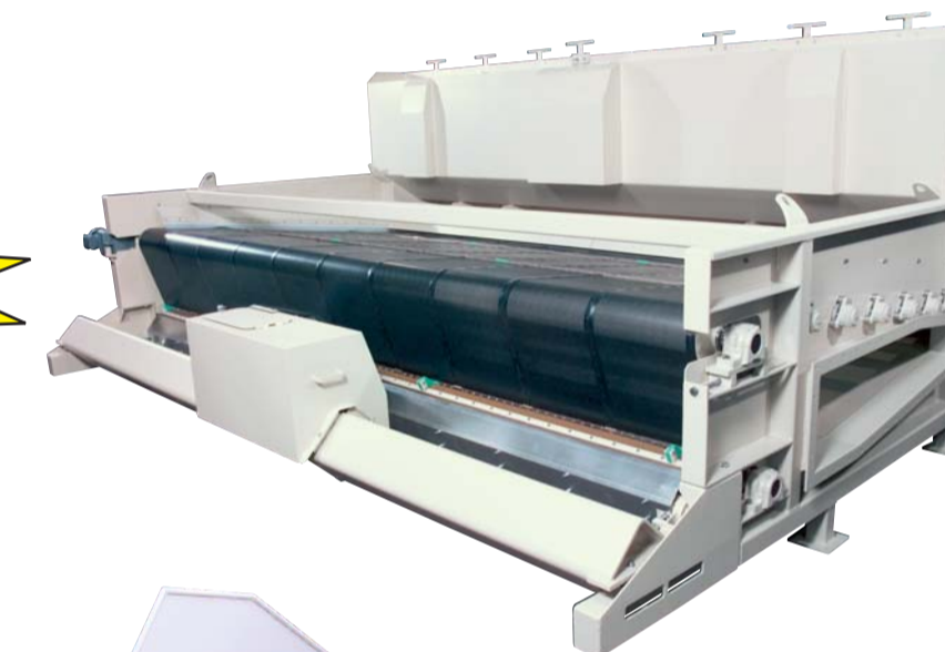
Schwemmwasserfilter Flume water filters Filtres à eaux boueuses