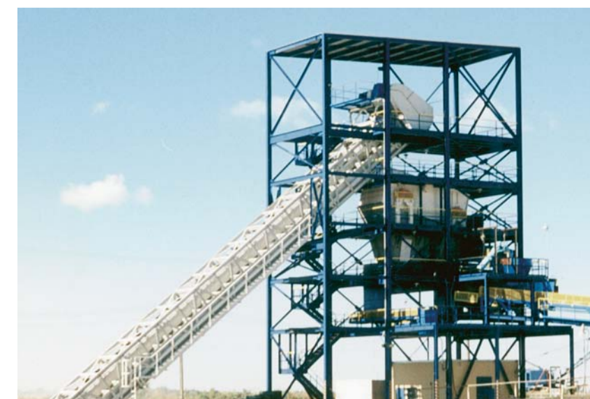
Komplette Enterdungsstationen Complete waterless soil removing stations Installations de décroûtage