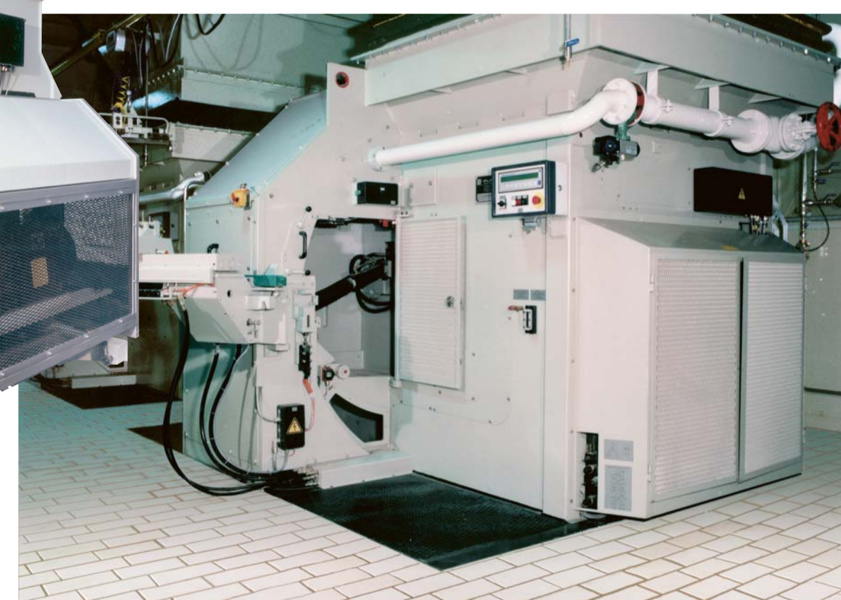
Vollautomatische Messeraufbereitungsmaschinen Automatic reconditioning machines Machines automatiques de préparation des couteaux