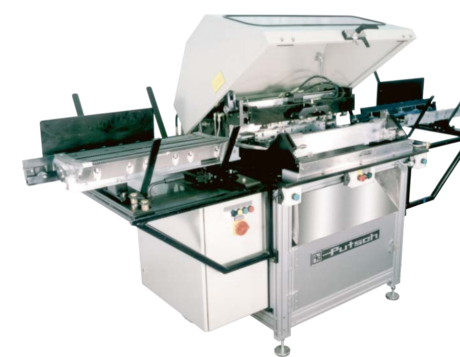
Schraubautomaten Automatic Wrenches Boulonneuses automatiques