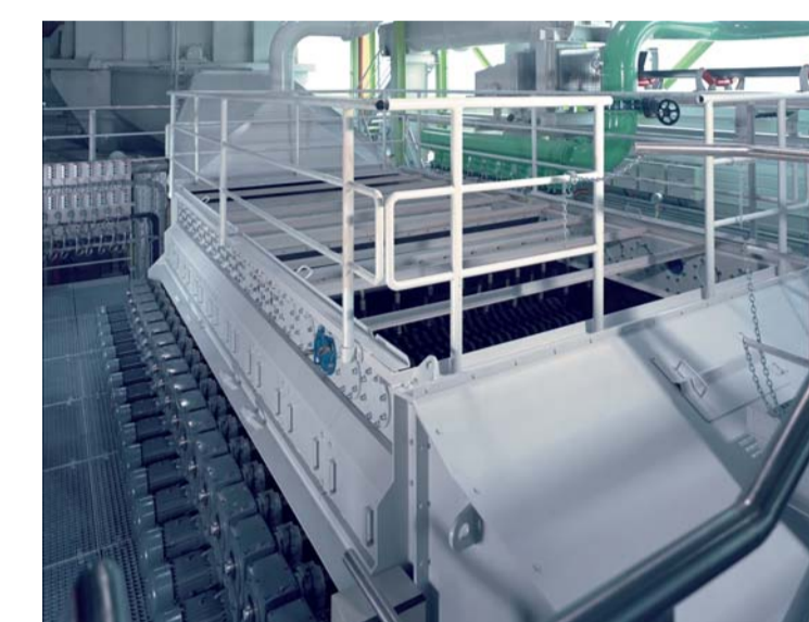
Düsen-Rollen-Wäschen Jet wash roller tables Laveurs à buses et à rouleaux