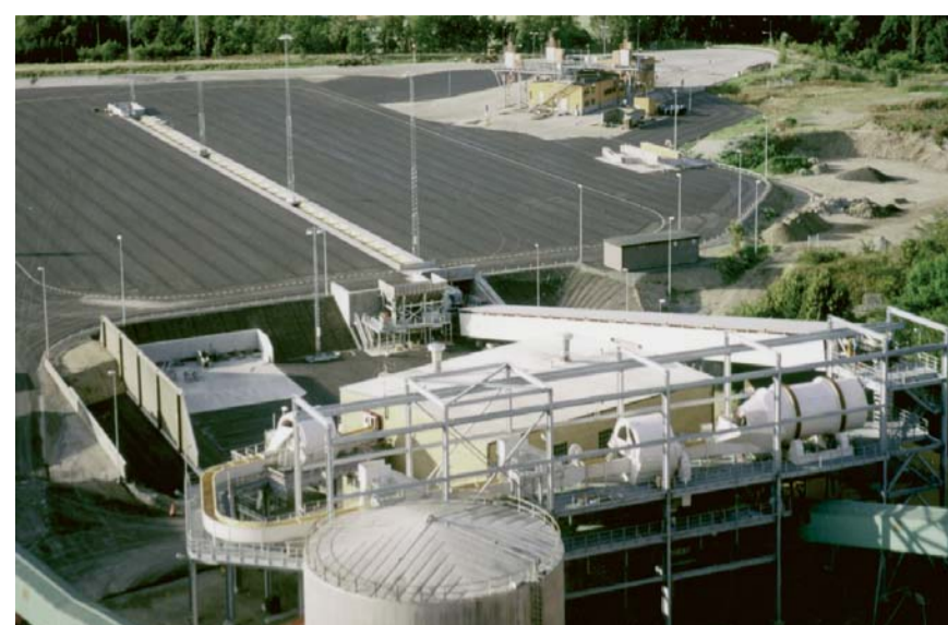
Rübenannahmen und Rübenwäschen Beet receiving plants and beet washing plants Cours à betteraves et lavoirs