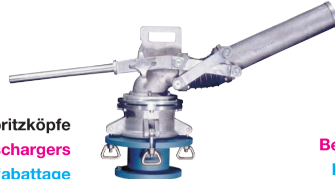
Handspritzköpfe Manual jet dischargers Lances d'abattage